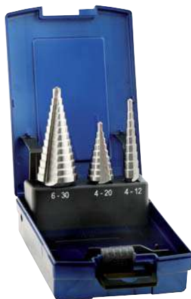
Set 3 Pcs