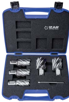
Set 5 Pcs