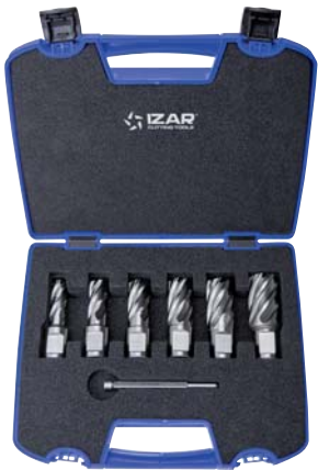
Set 6 Pcs