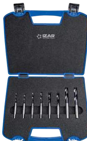
Set 8 Pcs