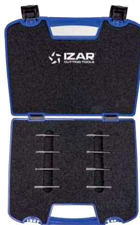
Mod. 3 8 Pcs

MATERIALES DUROS Hard Materials Matériaux Durs