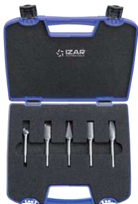
Mod. 1 5 Pcs